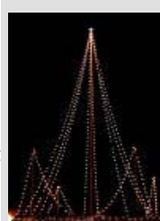
L-itwal u l-oghla arblu f'Malta mtella' f'sena 1988 sal-gurnata tal-lum.

Fl-1996 u fl-1997 saru t-nax il-bandalora tad-dawl għat-triq it-Torri San Gwann, waqt li fl-1995 sar l-armor tant sabieh ta' man-nicca ta' San Duminku tal-gebel fi Triq Boffa. Fl-1997 ukoll rega' inbidel id-drapp kollu tat-triq tal-knisja, u llum nistgħu nġhidu bla tlaqlieq li minkejja c-cokon tal-partit ta' l-istilla', il-festa dumnikana gewwa 'l-Birgu hija fost l-aqwa f'dak li hu armor, ta' drapp u njam, celebrazzjonijiet, briju u dak kollu li jagħmel festa tipikament maltija. Dan tant hu minnu li fis-sena 2000 inbeda l-proġett ambizzjuż tat-trofej tal-pjazza li huwa kwazi lest, dan l-armor, barra x-xogħol fid-drapp u l-injam tal-kolonna jinkludi ukoll il-festun tal-bozoz mdawwar madwar il-pjazza kollha.