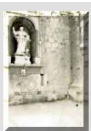
L-istatwa tal-gebel ta' San Duminku, thares l-isfel lejn triq il-Mina l-Kbira fis-sena 1877

Fil-kalendarju universali tal-knisja, il-festa ta' San Duminku tigi ccelebrata fit-8 ta' Awissu, imma fil-kalendarju dumnikan, il-qaddis isirulu festi ohra per ezempju fl-24 ta' Mejju issir it-tifikira tat-traslazzjoni tal-gisem ta' San Duminku f'Bolonja fl-1233.