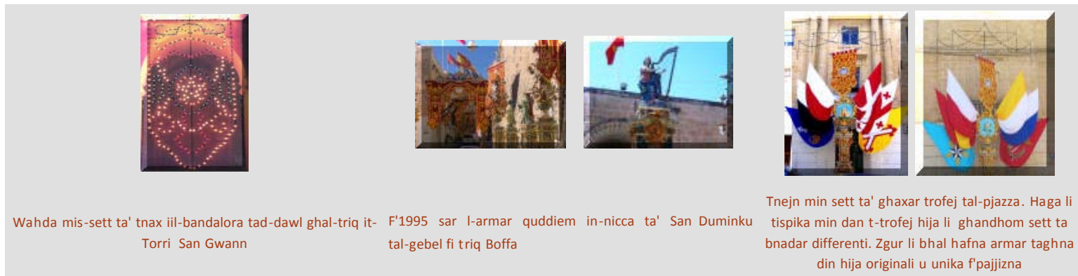
Wahda mis-sett ta' nax iil-bandalora tad-dawl għat-triq it-Torri San Gwann