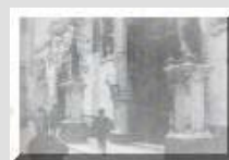
Il-faccata tal-knisja l-antika bl-istatwi ta' Darmanin, armati quddiemha, fis-snin ghoxrin