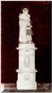
Statwa ta' omm San Duminku Govanna t'Azama' San Duminku. Statwa ta' Darmanin li ntilfet waqt il-gwerra.

Il-festa kellha tinqata' wara l-1939 minhabba t-tieni gwerra dinija li matulha d-dumnikani tal-birgu tilfu hafna mil-opri li kellhom u li kienu jzejni il knisja u l-kunvent taghhom. Kien waqt l-attakk fuq l-'illoustrous' tad-19 ta' Jannar 1941 meta il-knisja u l-kunvent intlaqtu mill-bombi germanizi. Il-festa, tista' tghid tilfet kollox, u l-ftit li gie salvat kellu hsarat kbar. Parti mill-patrijiet kellhom imorru fi Fleur de Lys sas-7 ta' Frar 1945, meta il-bqija tal-komunita' regghet inghaqdet mal-kumplament li kienu nizlu l-Birgu fit-18 ta' Dicembru 1942. F'dan iz-zmien, il-ftit armar li kien baqa' gie merfugh, parti fil-kantina tal-kazin tal-banda Prince of Wales Own u parti fil-pan terran tal-palazz ta' l-Inkwizitur, bil-konsegwenza li l-umditat' kompliet ziedet mal-hsara li kien diga' kellu. Mill-1943 sa l-1947 il-festa giet iccelebrata fuq gewwa biss, fil-palazz ta' l-Inkwizitur, ghax il-kapitlu tal-kunvent kien iddecieda li sakemm terga' titla il-Lunzjata l-gdida, ma kellhomx jaghmlu l-ebda purcissjoni. Minkejja dan, fit- 28 ta', Awissu 1948, giet inawgurata n-nicca l-gdida ta' San Duminku tal-gebel, li issa saret ezatt biswit Cuvre Porte fi triq Boffa, u dak n-nhar, ghall-ewwel darba wara l-gwerra daqqet il-banda Prince of Wales Own u regghu instemghu jidwu l-kant melodjuz tal-Kalaroga u n-noti brijuzi ta' l-innu marc.