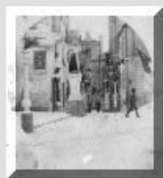
Parti mill-pjazza u in-nizla tax-xatt fis-sena 1881, meta f'Malta kienet ghadda ma dahliex is-sistema elettrika. Fost l-armor jidhru il-pilandi bil-lampi tal-gass