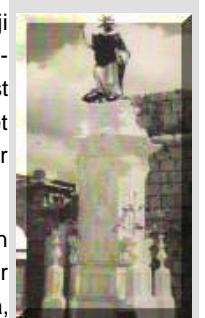
L-istatwa ta' San Duminku u l-kolonna gdida armata ghall-ewwel darba fi triq it-torri San Gwann ghall-festa ta' l-1957

Fis-sentejn ta' wara, 1958 u 1959, tista tghid sar kollox l-istess, izda bdiet tiehu sehem ukoll il-banda San Mikiel ta' Haz-Zabbar. Imma jekk l-1922 u l-1934 kienu snin importanti ghall-festa dumnikana tal-Birgu, zgur li l-1960 kellha tidhol fil-grajja glorjuza tad-dumnikani Vittorjozani. Fl-20 ta' Awissu 1960 wara dsattax-il sena, 'il-knisja tal-Lunzjata regghet fethet il-bibien taghha. Knisja gdida, arjuza u kompluta b'kollox. Min jista' jfisser il-ferh tal-partitarji numeruzi dumnikani f'dawk il-jiem? Kif kien mistenni saru festi specjali u sar hafna xoghhol, biex din l-okkazjoni unika tibqa mfakkra. Minkejja d-diffikultajiet kbar, it-toroq tar-rotot tal-marcijiet u l-purcissjoni ddawwlu kollha bil-festun u l-karti hodur bhala liedna maghhom, gew irrangati sitta mill-puttini li fil-knisja l-antika kienu mal-kolonna tal-korsija u tpoggew maz-zuntier tal-knisja l-gdida, gew restawrati aktar mill-istatwi tal-qaddisin ghal fuq is-sur u anke saru xi kolonna godda parigg dawk salvati mill-gwerra. Dik is-sena ukoll giet mizbugha u ndurata l-kolonna l-kbira, kif kienet l-antika, u minn dak iz-zmien bdiet tintrama fit-triq tal-knisja, hdejn il-kazin. Fil-festi hadu sehem il-baned San Gejtanu tal-Hamrun, San Gorg ta' Bormla, La Stella tal-Gudja u King's Own tal-belt u naturalment daqqet ghal diversi drabi il-banda Prince of Wales Own.