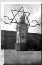
L-armar ta' fuq is-sur tal-kurdara qabel it-tieni gwerra