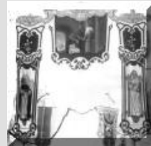
Tnejn mis-sett ta' disa pavaljuni godda bil-pittura li kienu juru episodji mill-hajja tal-qaddis missierna li saru ghal habta tal-hamsinijiet