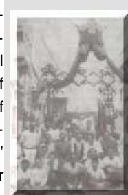
Triq il-mina il-kbira armata, fejn tidher sewwa il-kuruna

Hekk il-festa baqghet issir ghal 19-il sena, sakemm fil-31 ta' Lulju 1895 l-isqof Pietru Pace laqa' t-talba tal-patrijiet biex jibdedw jaghmlu purcissjoni bl-istatwa ta' San Duminku. Din l-ahbar gabet ferh kbir fost d-dumnikani; l-ghada li waslet, giet mill-Belt il-Banda 'ta' indri' u daqqet quddiem il-kunvent, u ghalxejn il-pirjol P. Guzepp Falzon ghamel kemm seta' biex iwarrab n-nies biex ma ssir l-ebda dimostrazzjoni. Fit-2 ta' Awissu, il-banda Duke of York's own (illum Prince of Wales Own) marret il-Belt biex taghmel dimostrazzjoni lill-isqof u l-pitghada il-banda Duke of Edinburgh (illum San Lawrenz) telghet b'marc sa quddiem il-kunvent, fejn giet milqugha b'ferh minn ta' l-istilla. Il-pirjol dahhal il-banda il-kunvent u ghamel diskors ta' okkazjoni. Wara kullhadd kien mistieden ghal riceviment fil-kazin 'ta' fuq'. Fil-5 ta' Settembru, il-provincjal, P. Vincenz Schembri, baghat ittra lill-kapitlu ta' San Lawrenz biex jistedinhom jiffunzjonaw huma fil-ghasar u jmexxu l-purcissjoni li kienet ser issir ghall-ewwel darba, izda din l-istedina ma gietx accettata.