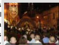
Il-programm muzikali mill-banda taghna Prince of Wales Own fuq s-Sur.

Hekk naraw li fil-bidu tas-snin tmenin, is-sibt lejlet il-festa, gie introdott il-programm muzikali mill-banda taghna Prince of Wales Own, li ha post il-bzonn li jkun hemm zewg baned. Dan beda jinkludi bicciet ta' muzika maghzula mill-arkivji tal-kazin, kif ukoll arangamenti muzikali aktar moderni li l-poplu numeruz li jattendi ta' kull sena, flimken ma mistidinien distinti, jilqghu u japprezza b'applaws kbar. F'dik il-habta ukoll, il-Hadd zdiedet banda ohra ukoll, kif ghadha sal-lum. Matul dan il-perjodu, l-istess element ried li jerga' jibda jsir il-marc ta' fil-ghodu, li kien ghadu qatt ma sar minn qabel il-gwerra. Din il-proposta ma kienetx giet accettata mill-kumitat tal-festa ghar-raguni li kien hemm prijoritajiet ohra. Minflok ghal xi snin il-gimgha, fl-ahhar tat-tridu, kienu jiehu sehem zewg baned. Fl-ahhar tas-snin tmenin beda jsir ikoll il-marc ta' l-ahhar bl-inzul ta' l-istatwa ta' San Duminku tal-kolonna.