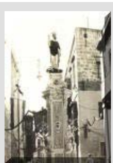
Il-kolonna il-kbira giet ndurata. bdiet tintrama fit-triq tal-knisja, hdejn il-kazin fis-sena 1960