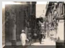
Sett pavaljuni u bandalori parigg li ntramaw fit-triq tal-knisja ghall-ewwel darba f'Malta