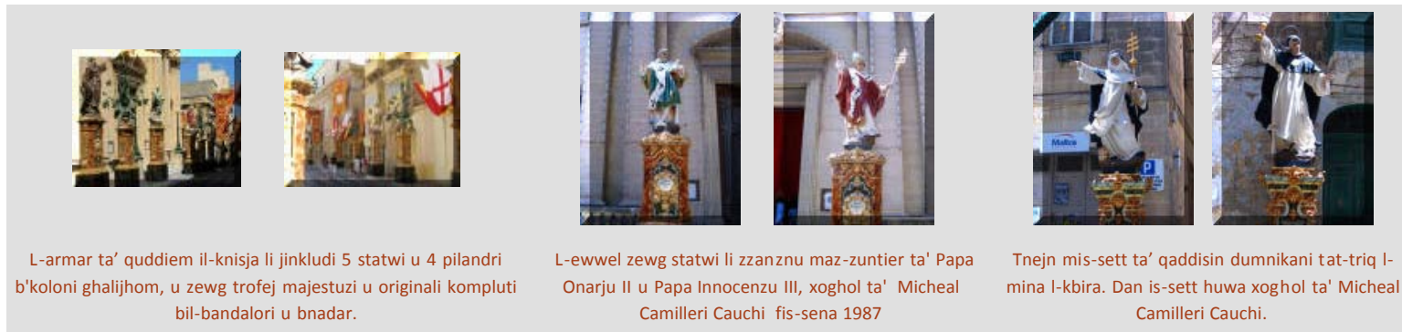
L-armor ta' quddiem il-knisja li jinkludi 5 statwi u 4 pilandri b'koloni għalijhom, u zewg trofej majestuzi u originali kompluti bil-bandalori u bnadar.

Fl-1980 saru pavaljuni u bandalori godda għat-triq tal-knisja, u ftit ftit bdew jizzejjnu bid-drapp toroq li qabel kien ikollhom biss festuni. Fl-1987 inbeda x-xogħol fuq l-armor ta' quddiem il-knisja u izzanznu l-ewwel zewg statwi maz-zuntier, xogħol Micheal Camilleri Cauchi, li wara kompli ukoll is-sett ta' qaddisin dumnikani għat-triq principali. Naturalment, dawn l-istatwi kien jinħtielhom il-kolonna li saru fuq stil tassew originali li nħadmu mill-membri tal-kumitat tal-festa, sfortunatament dan is-sett sal-lum għadu mhux komplut, izda kif jaf kulhadd, dan zgur mhux tort tal-kumitat, li min-naha tiegħu qed jagħmel minn kollox biex dan il-proġett hekk kbir ikun komplut.